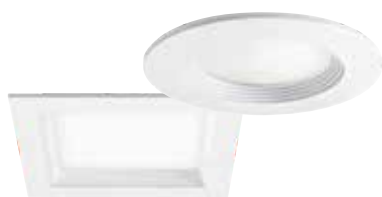
ELSA с круглым или квадратным корпусом

Датчики FLAT не только управляют осветительными приборами, но и расставляют акценты в дизайне интерьера, особенно в сочетании с лаконичными светильниками направленного вниз света, такими как модели ELSA или STINA от ESYLUX.