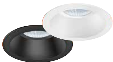
STINA черного или белого цвета